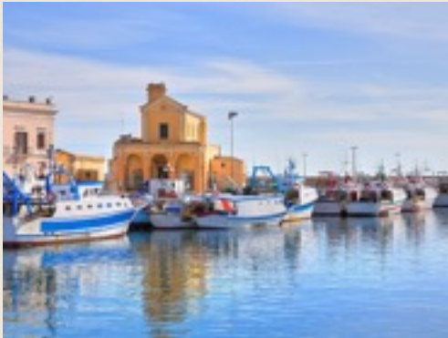
Le petit port de Gallipoli

Le règlement de la totalité du prix de l'hébergement devra être fait sur place à l'arrivé (paiement en espèces exclusivement).