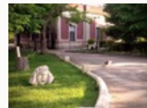
La Villa et le parc